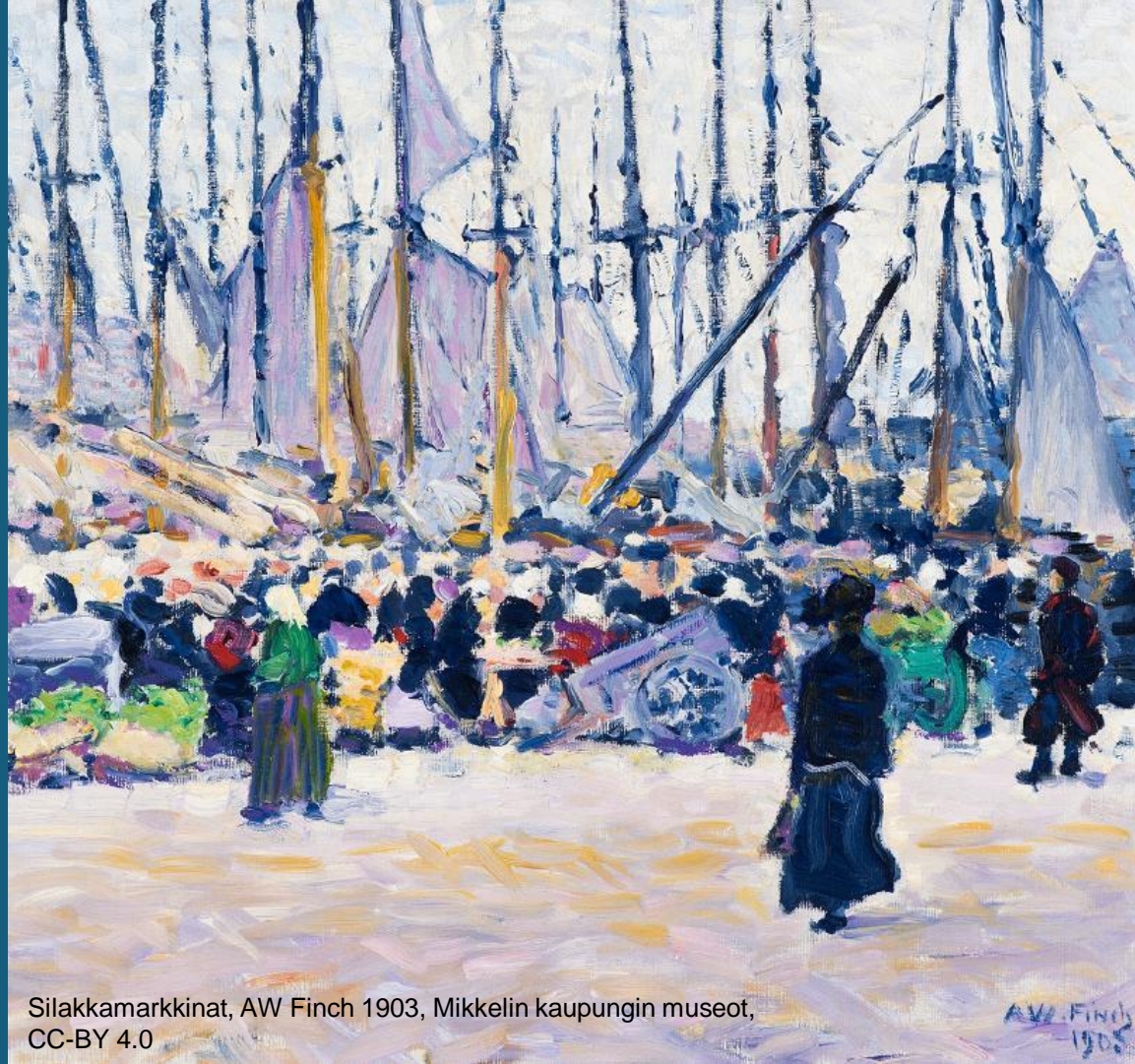
Silakkamarkkinat, AW Finch 1903, Mikkelin kaupungin museot, CC-BY 4.0