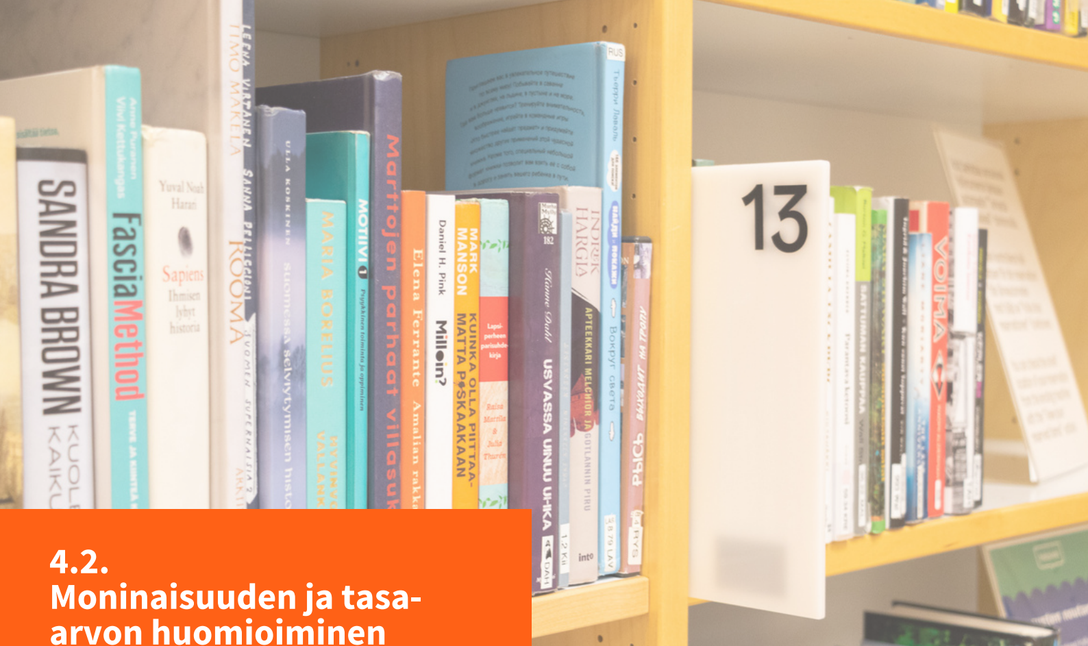
Kuva: Tuukka Jaromaa